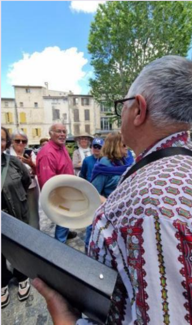
Le chapeau en peau de lapin

Les chasseurs et l'abattage fournissaient quantité de peaux de lapins et de lièvres. Le lapin, une fois vidé, était suspendu et « espillé » en retroussant sa fourrure. Ces peaux, dans les familles, étaient mises à sécher dans un coin aéré bourrées de pailles pour qu'elles ne rétrécissent pas et il suffisait d'attendre le passage du « peillarot », marchand ambulancier, collectant les étoffes usagées, les peaux de lapin, et divers objets de récupération, pour en faire commerce.