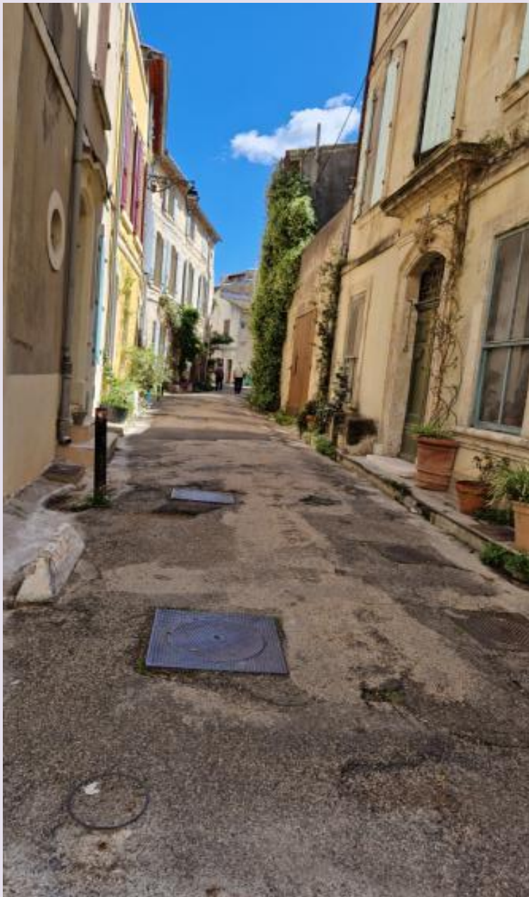
Rue Laurent Bonnemant