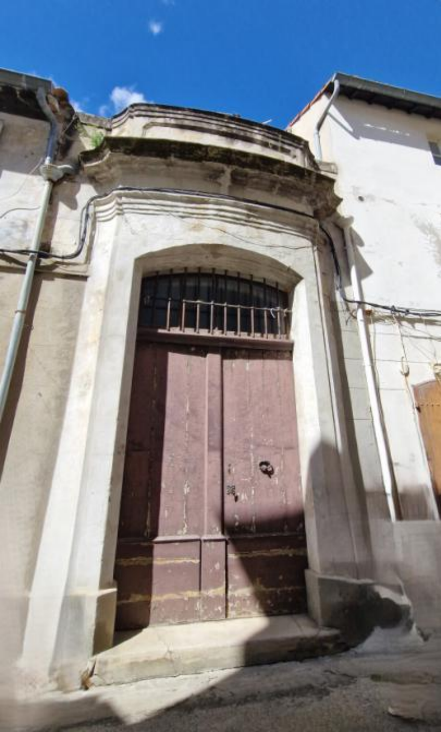
Porte de l'ancienne église Saint André englobée dans l'église Saint Laurent