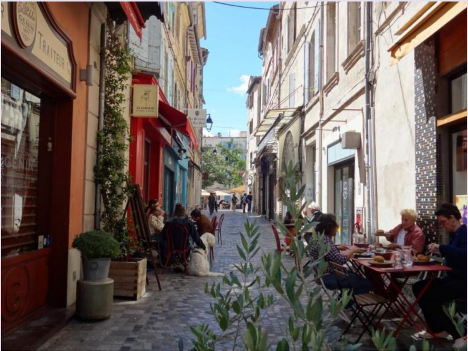
Rue des Porcelets