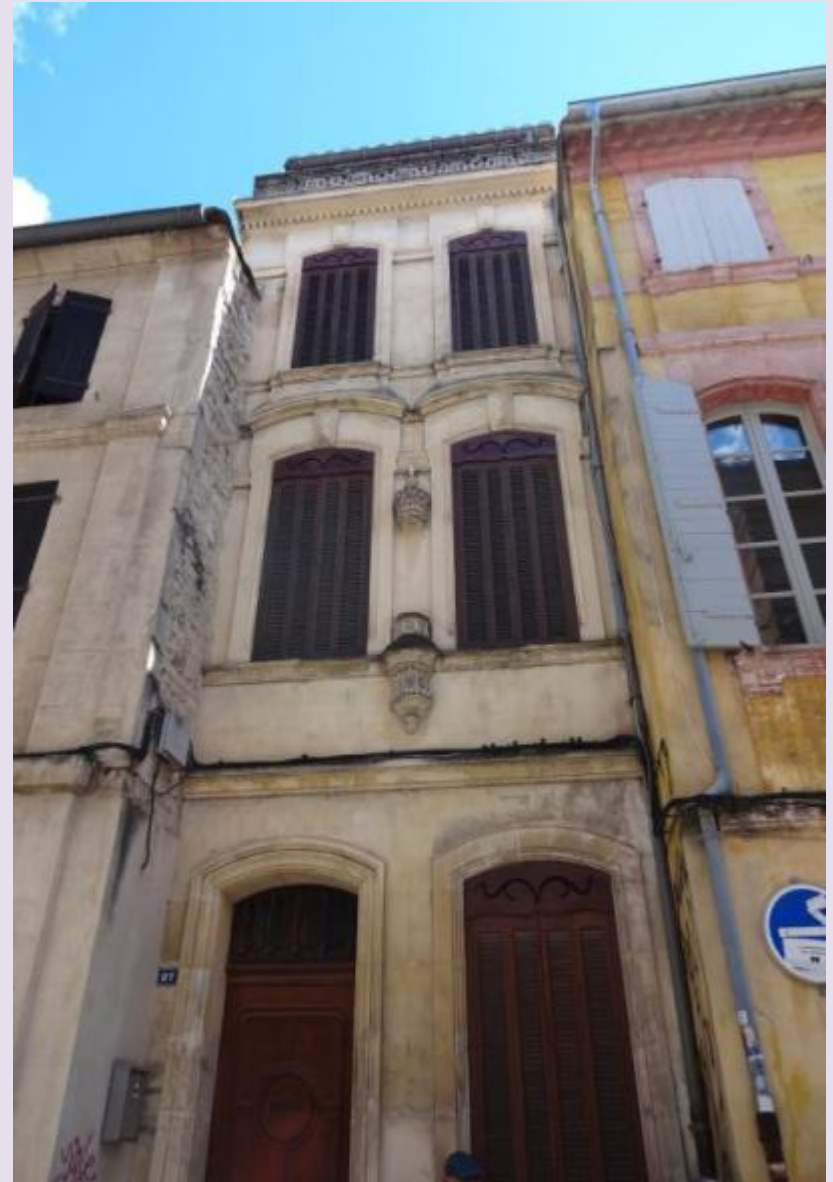
Rue de La Roquette