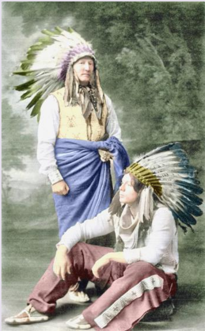
JOË HAMMAN ET FOLCO DE BARONCELLI POSANT EN COSTUME DE SIOUX

En 1905, Le marquis Folco de Baroncelli fait connaissance à Paris de Joe Hamman, qui lui présente Buffalo Bill à l'occasion d'une représentation de la tournée de sa troupe américaine en Europe. Baroncelli propose à ce dernier les services de ses gardians qui participent avec les Indiens et les cow-boys aux spectacles que Buffalo Bill organise alors dans le cadre de son Wild West Show. Il y trouvera l'inspiration pour créer ses jeux de gardians. A partir de 1909, Baroncelli met à disposition d'Hamman ses gardians et ses taureaux pour ses films faits en Camargue, qui seront parmi les premiers Westerns jamais tournés, conjointement à ceux réalisés eux Etats-Unis.