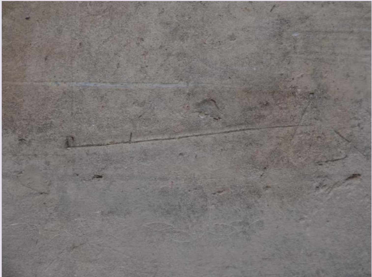
Graffitis laissés par les Indiens de Buffalo Bill : représentation d'un tipi avec un calumet