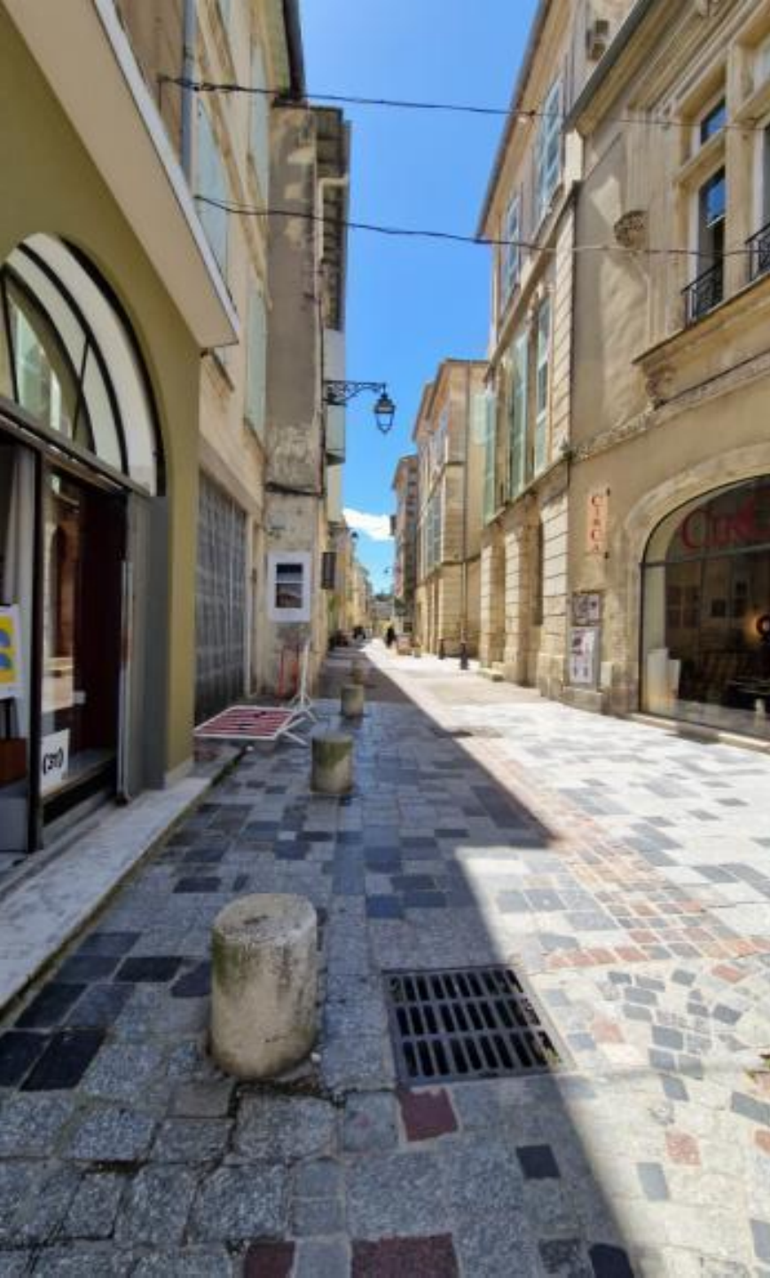
Rue de la Roquette