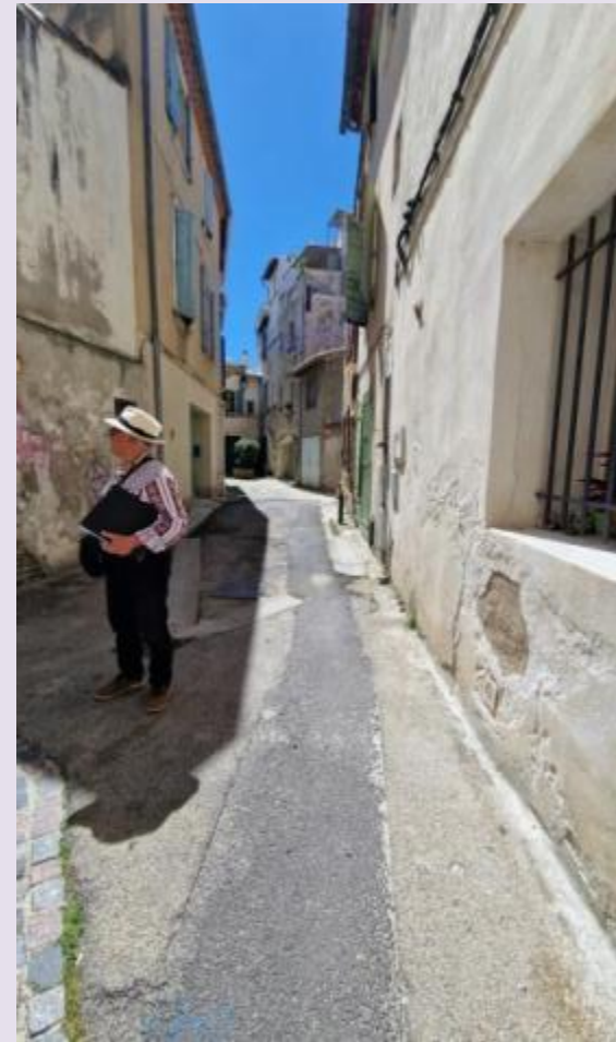
Rue des Vinatiers patronyme d'origine occitane, dérivé du latin "vinum" (vin) et du suffixe agent "-atier". Il désignait à l'origine un marchand de vin . Dans cette rue il y avait une distillerie