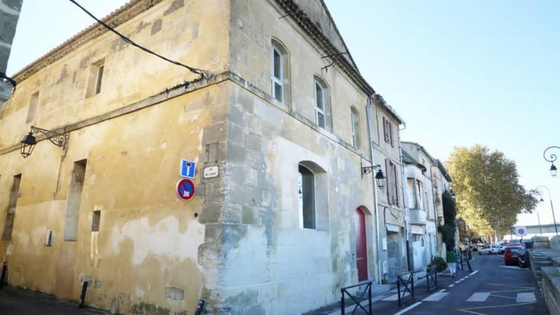
A l'angle de la rue des Salines et le quai de la Roquette se trouve l'ancien grenier à sel qui fût transformé en théâtre « La Calade » puis transformé à nouveau pour un campus de photographes