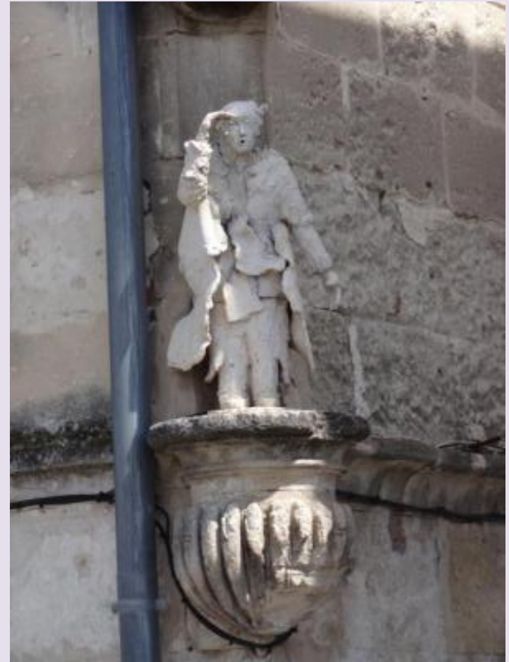
Une statue originale installée par un nouveau propriétaire rue Senebier