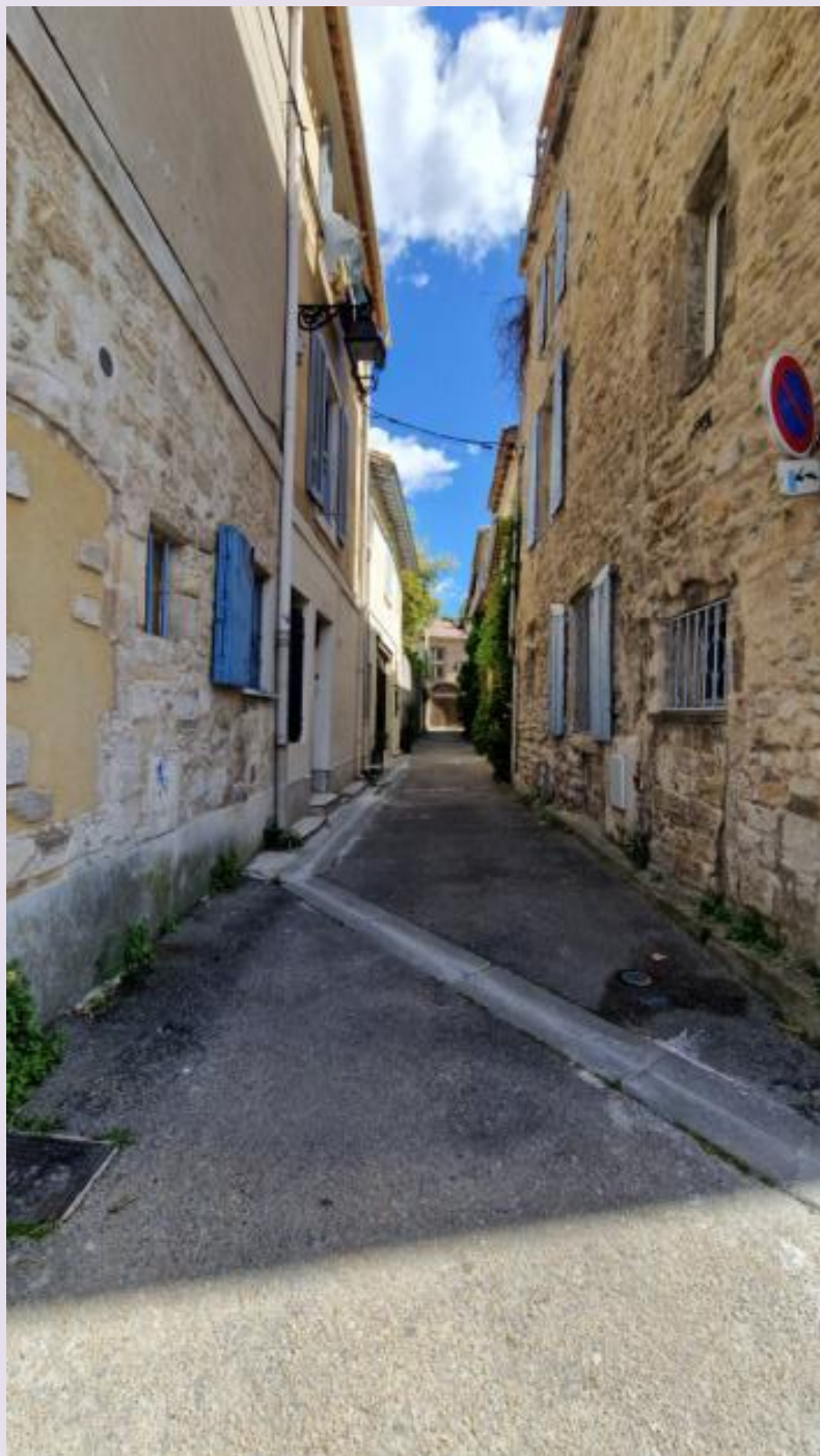
Rue des Douaniers