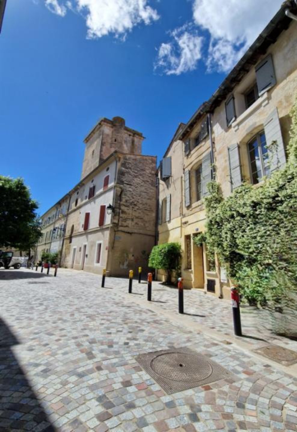
Place Joseph Patrat