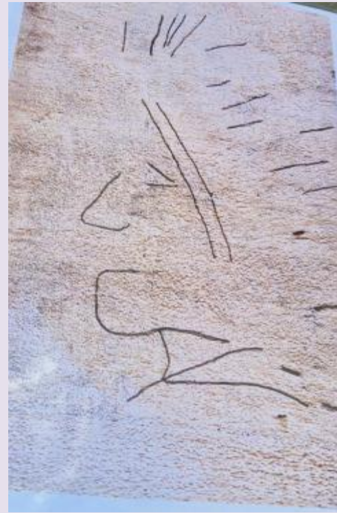
Une tête d'indien, photo retravaillée par Jean Claude Desarnaud.